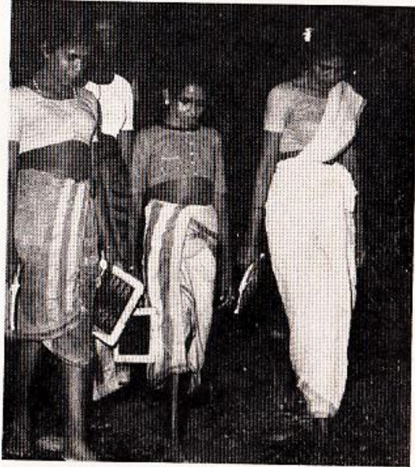
रात्रशाळा : अंधाराकडून उजेडाकडे...